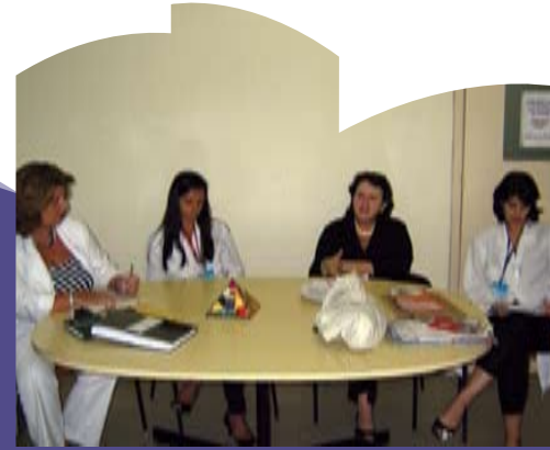
Na inauguração, foram ouvidos depoimentos sobre dificuldades na cessação do tabagismo

Os interessados em fazer o tratamento para cessação do tabagismo no HC III devem se inscrever pelos telefones 3879- 6391 ou 6373. O Centro de Estudos para Tratamento de Dependência à Nicotina é ligado à Coordenação de Assistência do INCA i