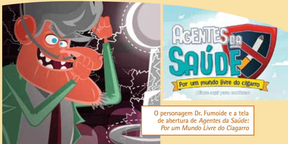
O personagem Dr. Fumoide e a tela de abertura de Agentes da Saúde: Por um Mundo Livre do Cigarro

O jogo está hospedado no portal do INCA na Internet. Desenvolvido em HTML 5, que não requer a instalação nem a atualização de outros programas, pode ser jogado em PCs e Macs, preferencialmente em navegadores com a versão mais recente instalada. Em breve o jogo será adaptado para tablets e smartphones.