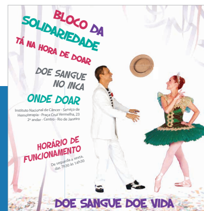
Banner de campanha de doação de sangue produzido pela Comunicação Social