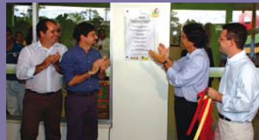
Tião Viana e Temporão descerraram a placa.

início de junho, em Rio Branco, graças a uma parceria entre os governos estadual e federal. Um investimento superior a R$ 5 milhões em obras e equipamentos instalados na Fundação Hospital Estadual do Acre (Fundhacre). A unidade tem capacidade inicial para atender a mil novos casos de câncer por ano, oferecendo tratamento oncológico completo (cirurgia, radioterapia, quimioterapia e cuidados paliativos), além de formar especialistas e desenvolver pesquisas que deverão fortalecer a Rede de Atenção Oncológica. Por ano, são estimados 640 novos casos de câncer no Acre. A implantação do centro faz parte do projeto de Expansão da Assistência Oncológica que o INCA desenvolve desde 2001, oferecendo treinamento de recursos humanos, equipamentos, infra-estrutura hospitalar geral e de rede, para adequar e garantir assistência integral aos pacientes de todo o País.