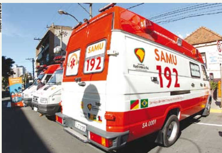
Plano inclui 4,2 mil novas ambulâncias