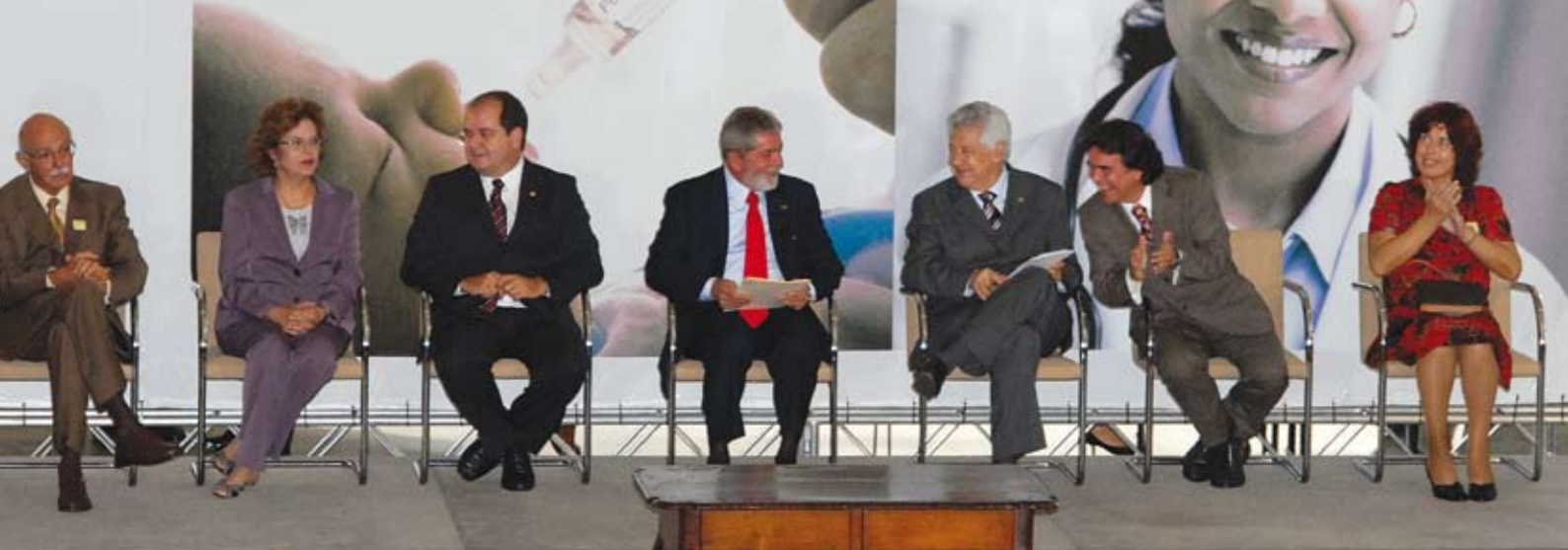
O presidente Luiz Inácio Lula da Silva, durante cerimônia de lançamento do PAC da Saúde, no Palácio do Planalto