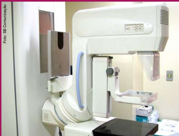
Mamógrafos serão avaliados no projeto piloto