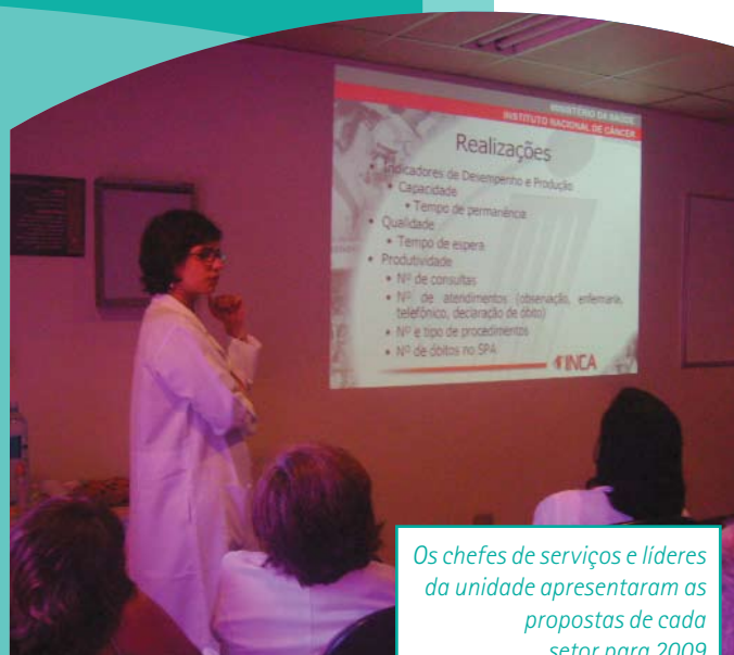
Os chefes de serviços e líderes da unidade apresentaram as propostas de cada setor para 2009

gerenciamento dos processos assistenciais e administrativos. Entre as novas tecnologias a serem implantadas, destaca-se o novo sistema eletrônico do Serviço de Assistência Domiciliar, que será instalado em aparelhos de computadores portáteis. Com o programa, a equipe multiprofissional poderá agendar visitas, verificar a disponibilidade de medicamentos e agilizar processos administrativos do setor. i