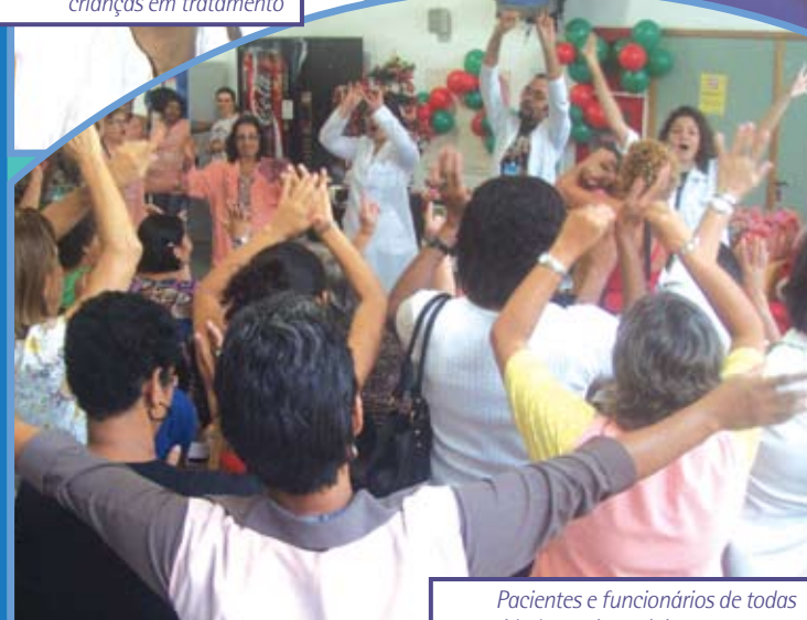
Pacientes e funcionários de todas as unidades assistenciais comemoram

cionários e acompanhantes assistiram à apresentação dos corais da Caixa de Previdência dos Funcionários do Banco do Brasil (Previ) e do Colégio Pedro II – unidade Engenho Novo.