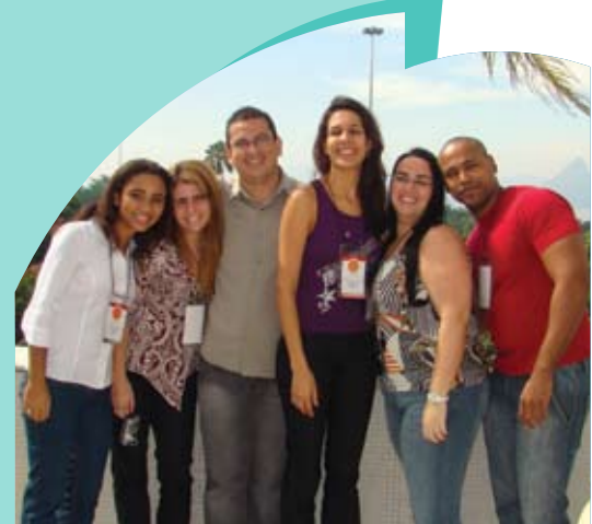
Os alunos que elaboraram o estudo ficaram satisfeitos com o resultado da pesquisa

O trabalho foi apresentado no Congresso Brasileiro de Fisioterapia , que aconteceu de 23 a 25 de outubro em Curitiba, e recebeu o prêmio de melhor tema livre oral. i