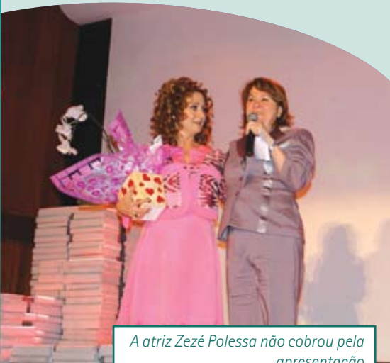
A atriz Zezé Polessa não cobrou pela apresentação

O encontro anual de voluntários do INCA, no 8º andar do prédio-sede, reuniu quase 700 voluntários que atuam em diferentes unidades do Instituto. Realizado no dia 4 de dezembro, o evento celebrou antecipadamente o Dia Internacional do Voluntariado, comemorado dia 5.