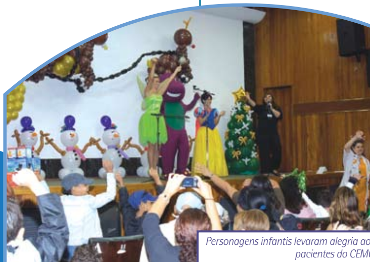
Personagens infantis levaram alegria aos pacientes do CEMO

Música e sorteio animaram as unidades de Vila Isabel. Enquanto no HC III um sorteio deu o tom da comemoração, no HC IV, pacientes, fun-