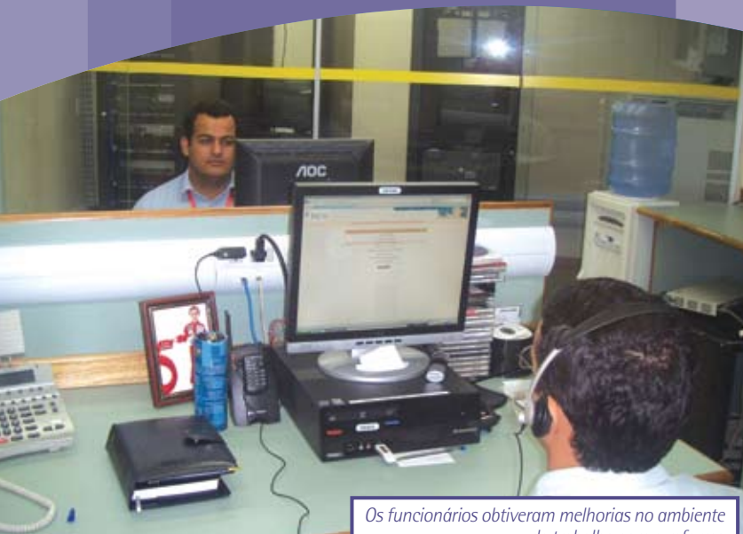
Os funcionários obtiveram melhorias no ambiente de trabalho com a reforma

O HC II inaugurou, no fim de 2008, a nova sala da informática. Localizado no 2º andar do prédio antigo, o setor foi dividido em dois ambientes, climatizados e separados por um vidro. Uma área foi destinada ao suporte técnico, na qual serão realizados os atendimentos em geral, e a outra metade reservada aos racks (móveis) e servidores.