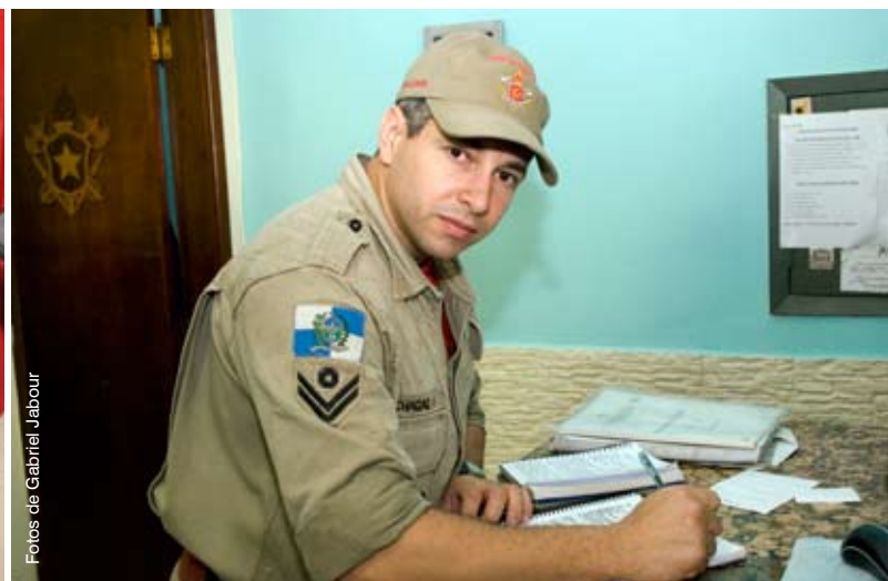
No dia-a-dia, tranqüilidade para planejar as tarefas