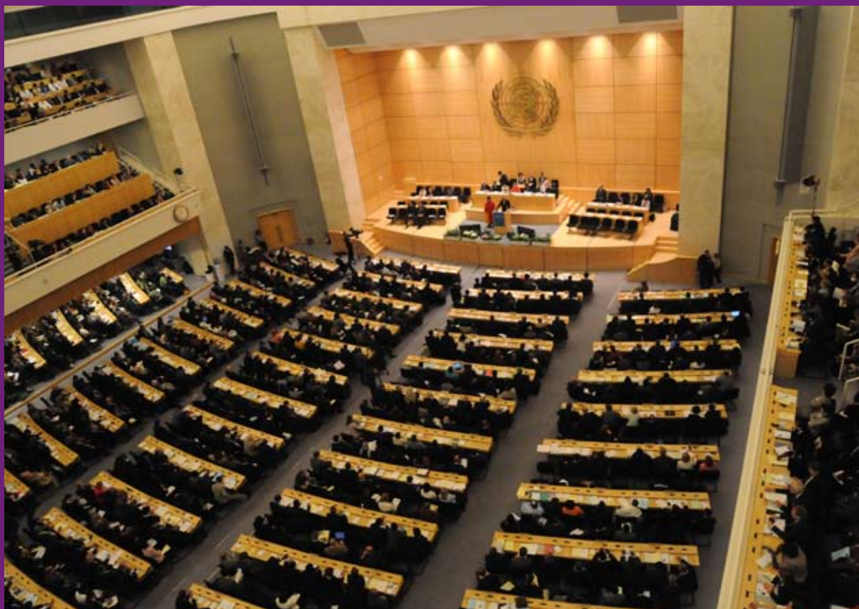
A 61ª Assembléia Mundial de Saúde reuniu 2.700 participantes, em maio, na Suíça

Um estudo da ONG internacional Essential Action apontou que 61 das mais de 110 entidades signatárias contam com financiamentos oriundos de indústrias farmacêuticas. Destas, nove são brasileiras e três delas afirmam dedicar-se ao controle do câncer: Associação Brasileira do Câncer (ABCâncer), Associação Brasileira de Linfoma e Leucemia (Abrale) e Federação Brasileira de Instituições Filantrópicas de Apoio à Saúde da Mama (Femama). Em 2007, durante a rodada de ouvido-