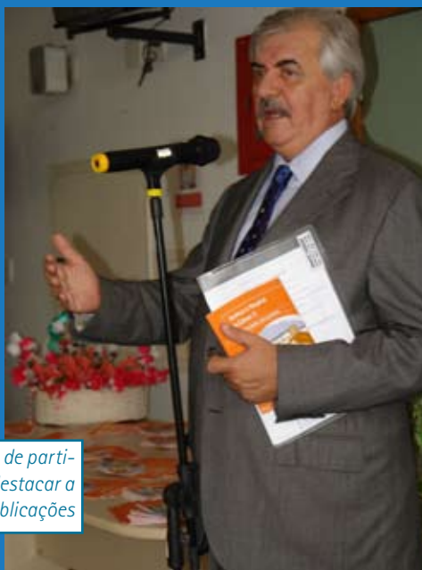
O diretor-geral fez questão de participar dos lançamentos e destacar a importância das publicações