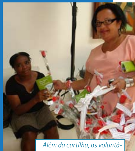
Além da cartilha, as voluntárias entregaram uma rosa às mulheres no HC II...